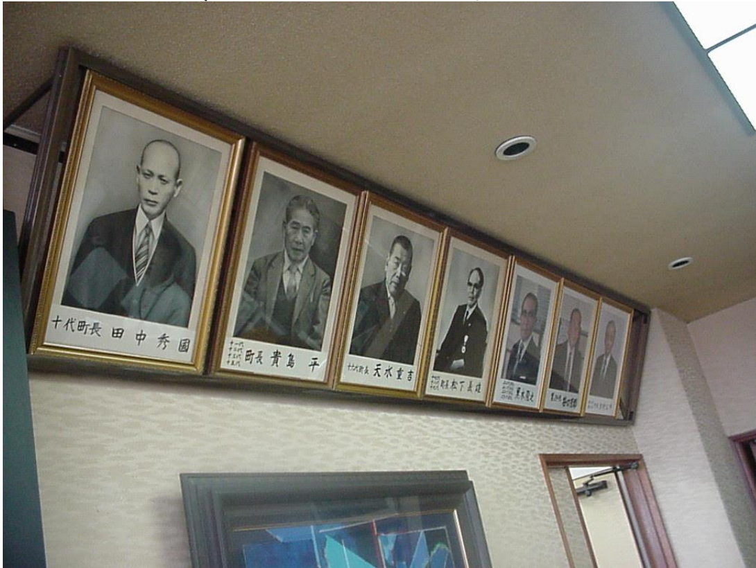
町長応接室には歴代の町長の写真が厳かに飾られて