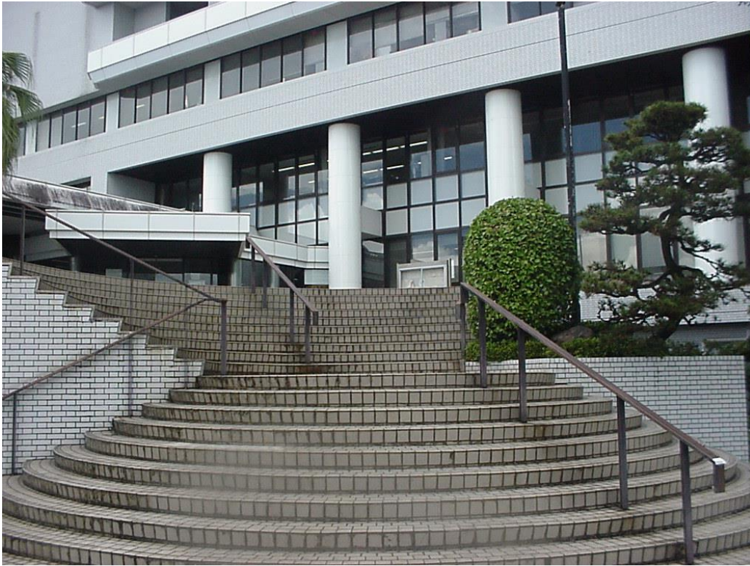
大変立派な町役場 “千軒太鼓発祥の地”